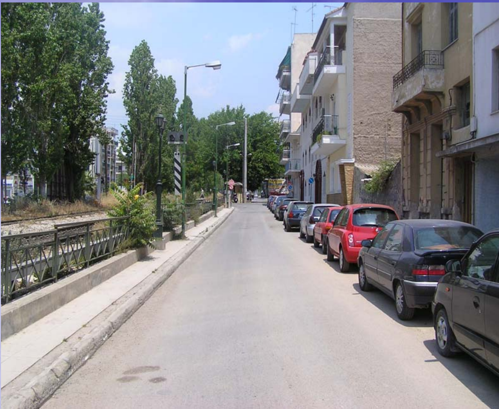
Αγωγός εκτροπής Κυκλοβόρου στο τμήμα επί της ανατολικής πλευράς Κωνσταντινουπόλεως