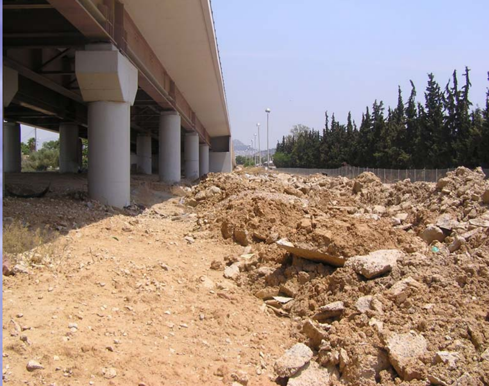
Αγωγός εκτροπής Κυκλοβόρου/ Ιλισού (μερική) στο τμήμα ανάτη της συμβολής με τον αγωγό διευθέτησης ρ. Προφ. Δανιήλ