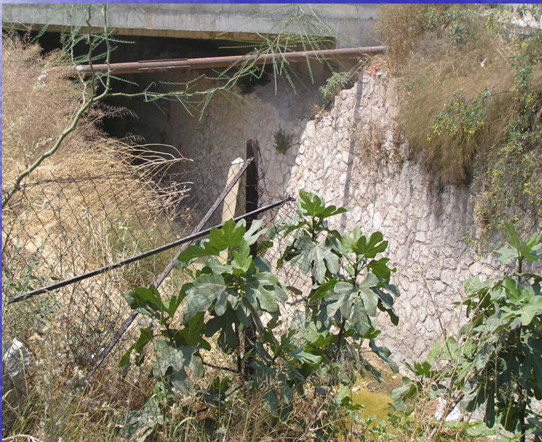
Υφιστάμενη εκβολή Ρ. Προφ. Δανιήλ στον Κηφισό (αριστερή όχθη και τμήμα κάτω από Δεξιά Παρακηφισία Λεωφόρο προς κοίτη Κηφισού)