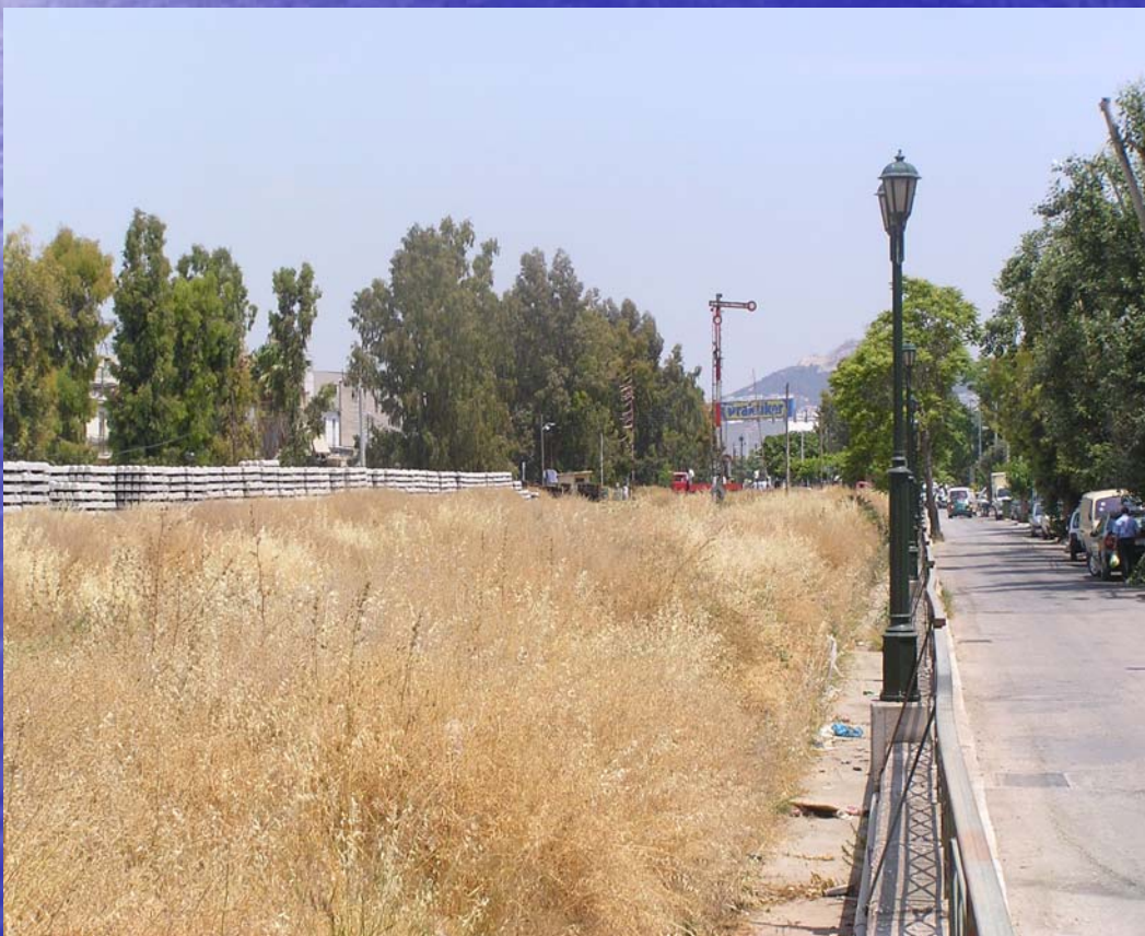
Αγωγός εκτροπής Κυκλοβόρου στο τμήμα κατόντη της συμβολής με τον αρχαίο μισακός εκτροπής Τησεύ