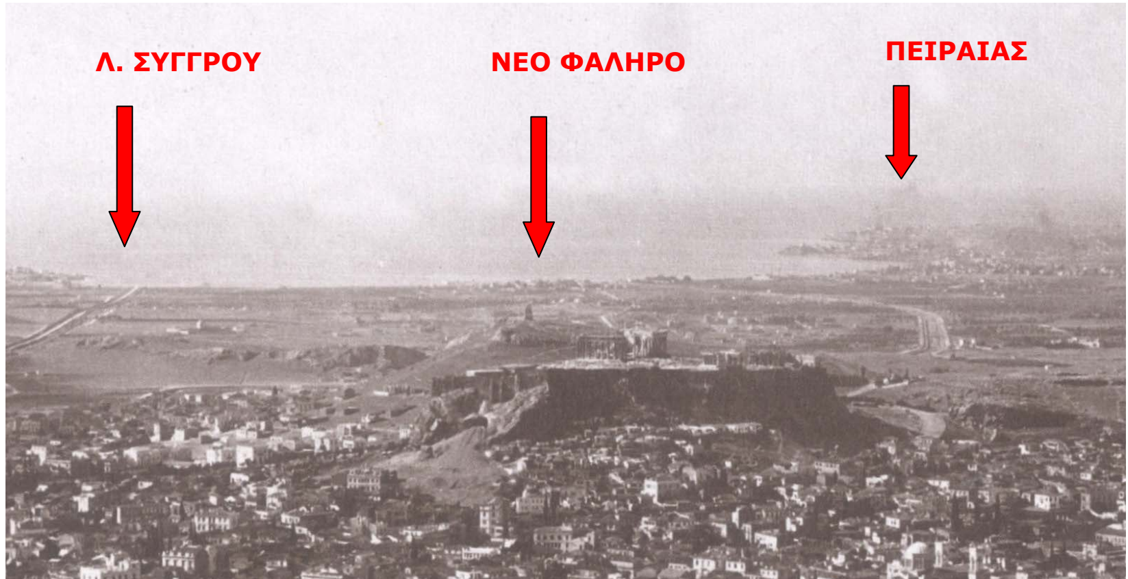
Συλλογή Hurbert Pernot, Νεοελληνικό Ινστιτούτο της Σορβόνης ΕΞΕΡΕΥΝΩΝΤΑΣ ΤΗΝ ΕΛΛΑΔΑ, Φωτογραφίες 1898 – 1913, Εκδόσεις ΟΛΚΟΣ