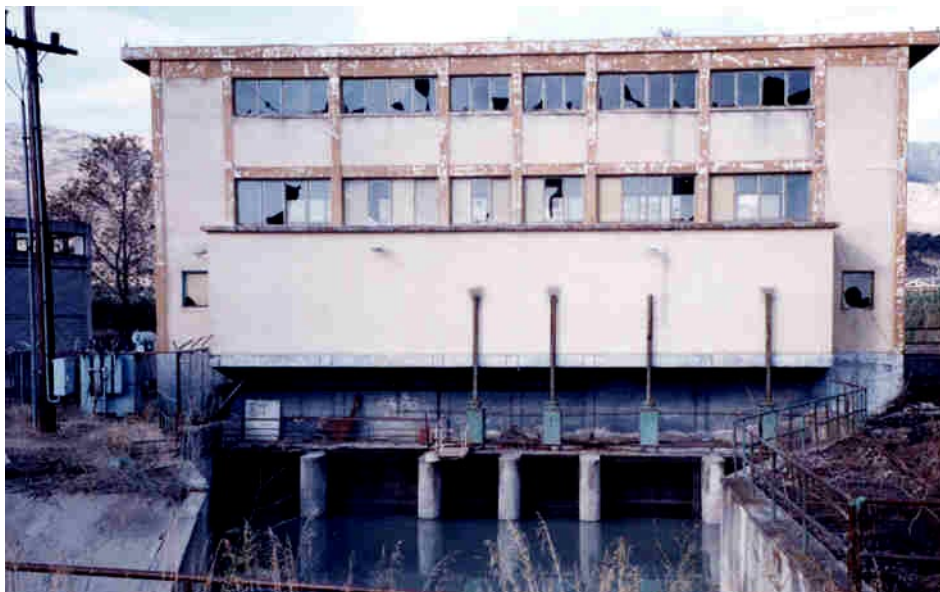
Σχ. 2 Χαρακτηριστική εικόνα που προδίδει μειωμένη φροντίδα και συντήρηση ενός αντλιοστασίου στην περιοχή των εγγειοβελτιωτικών έργων του Κάτω Αχελώου.