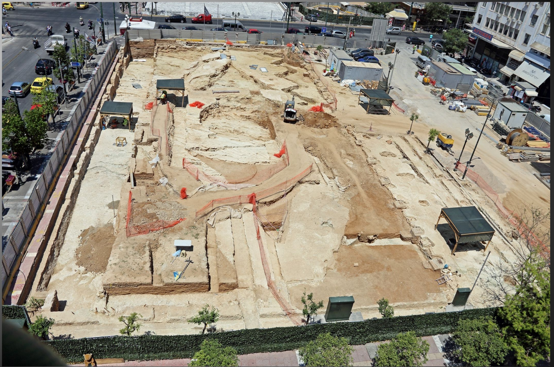
Εξέλιξη της ανασκαφής στη Πλ. Αγίου Κωνσταντίνου