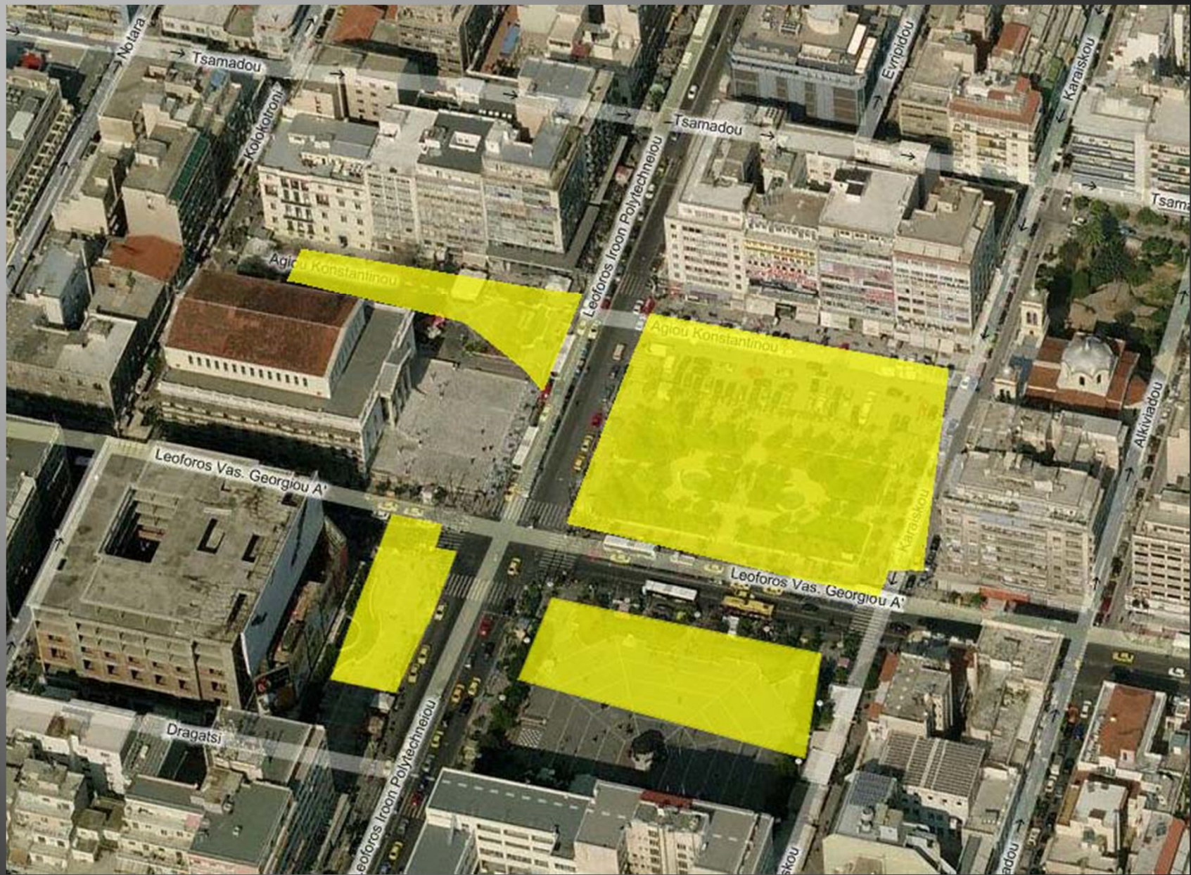
Συνολική διερευνηθείσα έκταση στο Σταθμό Δημοτικό Θέατρο