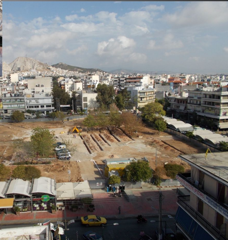
Πλ. Ελευθερίας (Κορυδαλλός)