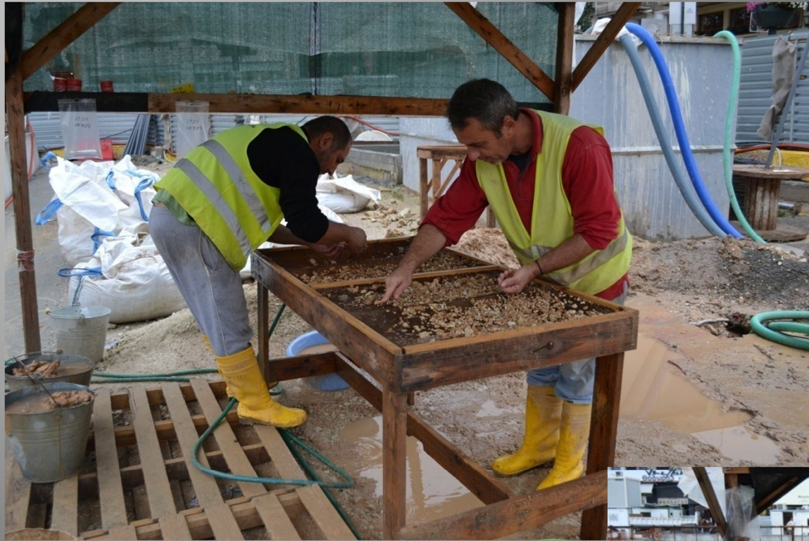
Υγρό κοσκίνισμα των επιχώσεων