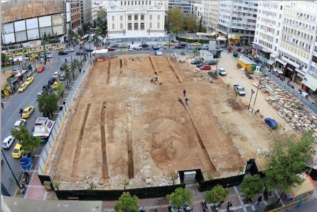
Πλ. Αγ. Κωνσταντίνου (Δημοτικό Θέατρο)