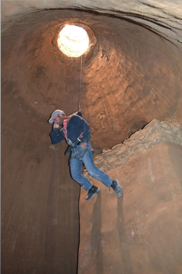
Καταβίβαση με τη χρήση των ειδικών τριπόδων