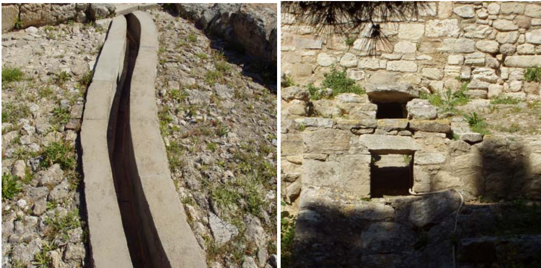
Εικόνα 2. Τμήματα του συστήματος αποχέτευσης στο ανάκτορο της Κνωσού, εντός του ανακτόρου (αριστερά) και στην έξοδο του κεντρικού αποχετευτικού αγωγού (δεξιά).

«Αίθουσας της βασίλισσας» με τα παράπλευρα σε αυτή διαμερίσματα, η αποχέτευση των υγρών αποβλήτων γινόταν δια μέσου πέντε τουλάχιστο φρεατίων τα οποία δέχονταν και τα απόβλητα μιας τουαλέτας. Το σύστημα αποχέτευε και τα όμβρια από τη στέγη και συνδεόταν πιθανώς με τις τουαλέτες στους ανώτερους ορόφους. Ο κεντρικός αγωγός είναι διαστάσεων 79 \times 38 cm, κατασκευασμένος από πέτρες και επιχρισμένος με κονίαμα. Το αρκετά μεγάλο μέγεθός του επέτρεπε τη διάβαση για τον καθαρισμό ή τη συντήρησή του. Τέλος, κατά διαστήματα υπήρχαν οπές για αερισμό (Graham, 1987). Τμήματα του αποχετευτικού συστήματος φαίνονται την Εικόνα 2.