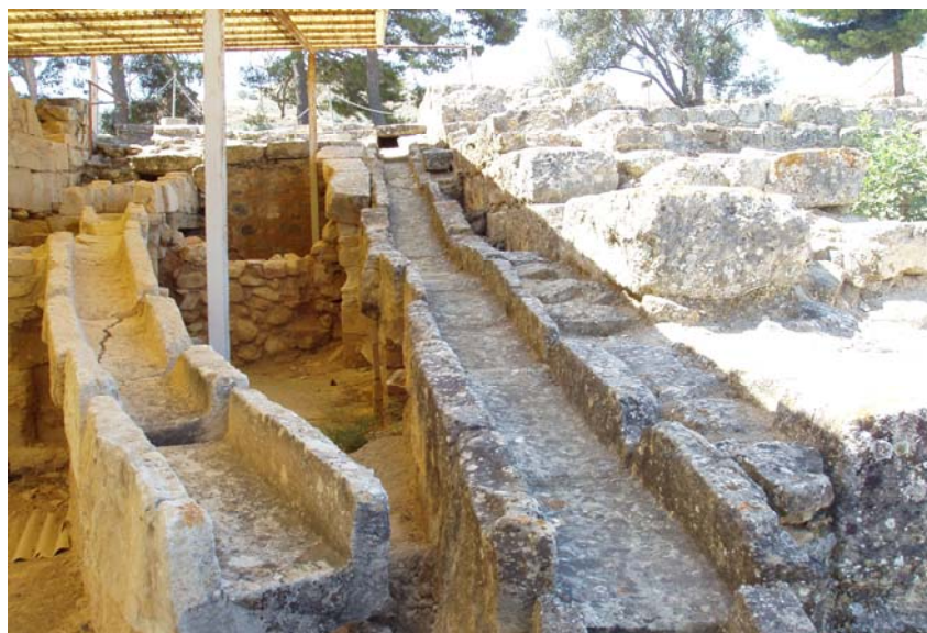
Εικόνα 4. Τμήμα του αποχετευτικού συστήματος στην Αγία Τριάδα.

Το πιο προηγμένο μινωικό αποχετευτικό σύστημα φαίνεται να είναι αυτό στην έπαυλη της Αγίας Τριάδας (Εικόνα 4). Το σύστημα αυτό προκάλεσε το θαυμασμό διαφόρων, μεταξύ των οποίων είναι ο ιταλός συγγραφέας Angelo Mosso που επισκέφτηκε την περιοχή στις αρχές του 20 ου αιώνα. Κατά τη διάρκεια μιας έντονης βροχόπτωσης, παρατήρησε ότι οι αγωγοί λειτουργούσαν τέλεια και κατέγραψε το περιστατικό αναφέροντας: «Αμφιβάλλω αν υπάρχει άλλη περίπτωση αποχετευτικού συστήματος ομβρίων που να λειτουργεί 4000 χρόνια μετά την κατασκευή του». Ο αμερικανός H. F. Gray (1940) που μεταφέρει την ιστορία συμπληρώνει: «Ίσως μπορεί να μας επιτραπεί να αμφιβάλλουμε αν τα σύγχρονα αποχετευτικά συστήματα θα λειτουργούν σε χίλια έστω χρόνια».