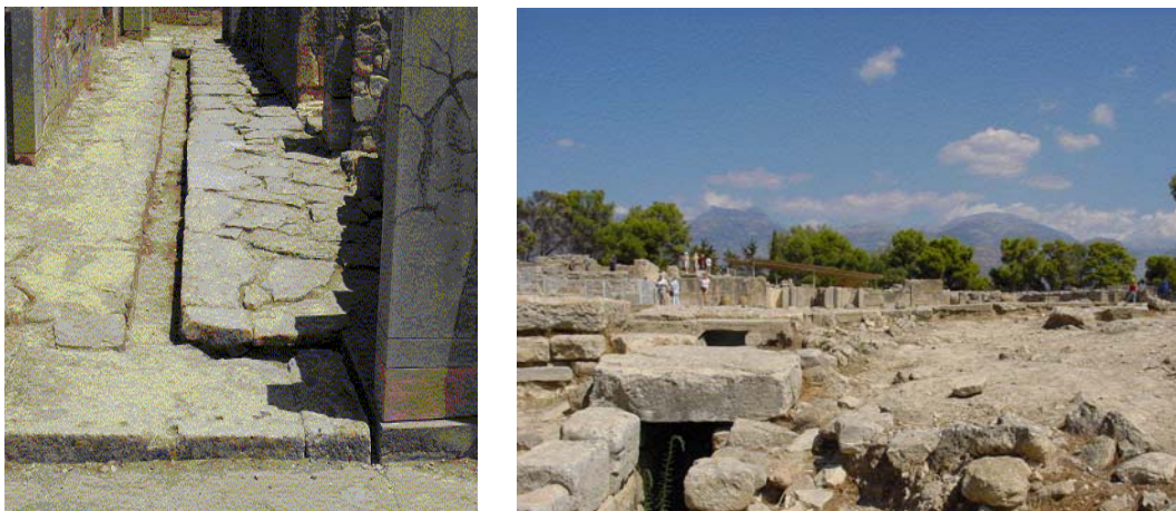
Εικόνα 3. Τμήματα του συστήματος αποχέτευσης στο ανάκτορο της Φαιστού: τμήμα εντός του ανακτόρου (αριστερά) και κεντρικός αποχετευτικός αγωγός (δεξιά).